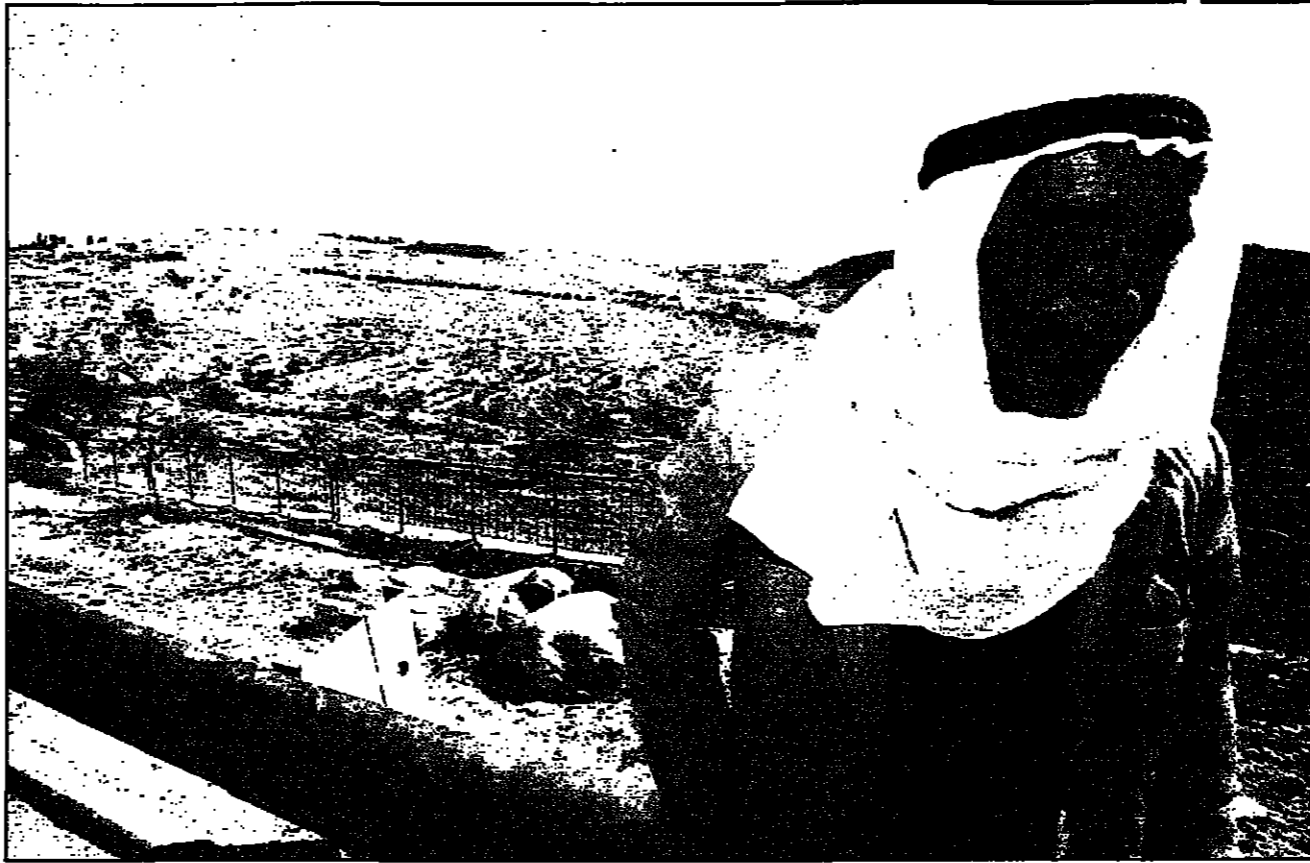
فلسطيني يقيم ايام منطقة جبل غيم التي تخطط اسرائيل لاقامة حي يهودي فيها